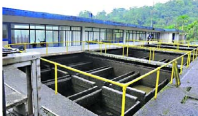
El bajo caudal del río Escalerete ha obligado a un racionamiento de agua en Buenaventura

La Sociedad de Acueducto y Alcantarillado de Buenaventura envía car-