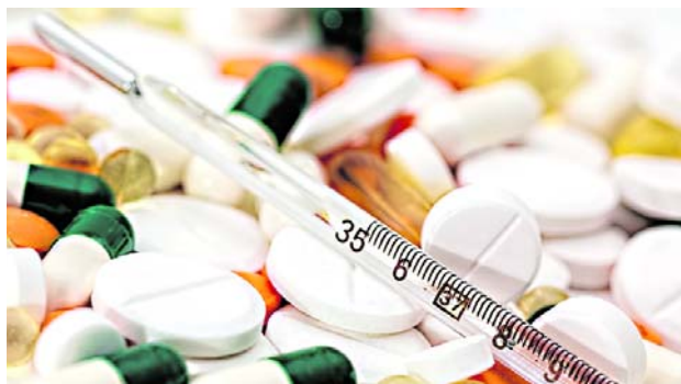
Invima expresó su preocupación por el desabastecimiento de medicamentos.

Así mismo indicó en un comunicado que en la actualidad se tiene respuesta inoportuna o inexistente a los requerimientos que hace el Invima vía correo desabastecimiento@invima.gov.co, en el que se solicitan entre otros datos: históricos de comercialización y proyecciones de producción a Titulares de registro sanitario e Importadores”.