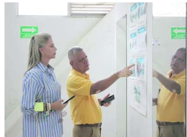
El Valle del Cauca tendrá jardines infantiles nocturnos.

Además, expresó que tiene la esperanza en participar no solamente desde el punto de vista de tecnología, sino en transferencia de conocimientos y aportar en la innovación y la competitividad de la región.