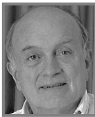
GUSTAVO ÁLVAREZ GARDEAZÁBAL

A raíz de mi comentario de hace unos días sobre la urgente necesidad de reformar el esquema total de la educación en Colombia, y lo anticuado de la metodología que se continúa empleando, un ávido lector de cifras y de comparar los efectos de ellas en un país que las desecha, me ha hecho llegar lo que debería ser considerado como la radiografía de un país que se desbarata no por el mal o controvertido gobernante de turno sino porque estructuralmente hemos dejado crecer las brechas que nos dividen. Según esas cifras en las últimas pruebas Saber 11 el puntaje de los alumnos rurales apenas alcanzó 233 puntos mientras que los urbanos llegaron cómodamente a 262. Desde 2014, que se realizan esas pruebas, este último resultado es el más abultado, pero nadie dijo nada, ni a los maestros les dio vergüenza ni a