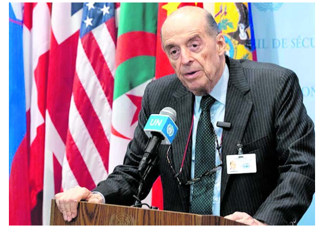
Una nueva investigación se abrió contra el canciller Alvaro Leyva Durán.

Se conoció que dicho contrato tenía un valor de 1.072 millones de pesos, pero se habría presentado un sobrecosto y, según los testimonios recolectados por la Corte, esos recursos fueron obtenidos por un valor cercano a los 200 millones de pesos.