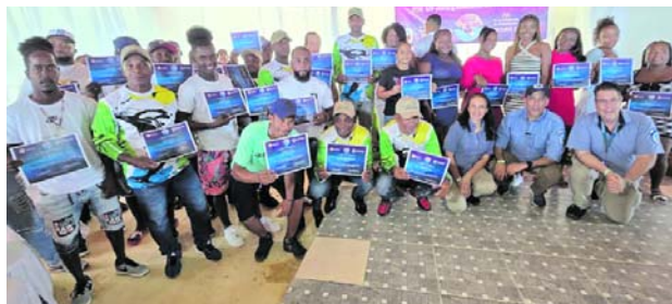
Los consejos comunitarios de Bahía Málaga están comprometidos con la conservación de este espacio biodiverso.

En Buenaventura se reunieron Parques Nacionales Naturales de Colombia y los