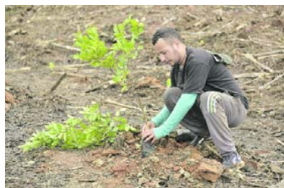
El Valle del Cauca se consolida como el primer departamento sostenible según el Índice Departamental de Competitividad 2024.

Pérez dijo que “somos el departamento donde estamos produciendo de una manera más limpia, los que más estamos cuidando nuestros bosques, que es donde nos encontramos en el trabajo con la CVC y somos el departamento que menos estamos deforestando en el país y eso es un