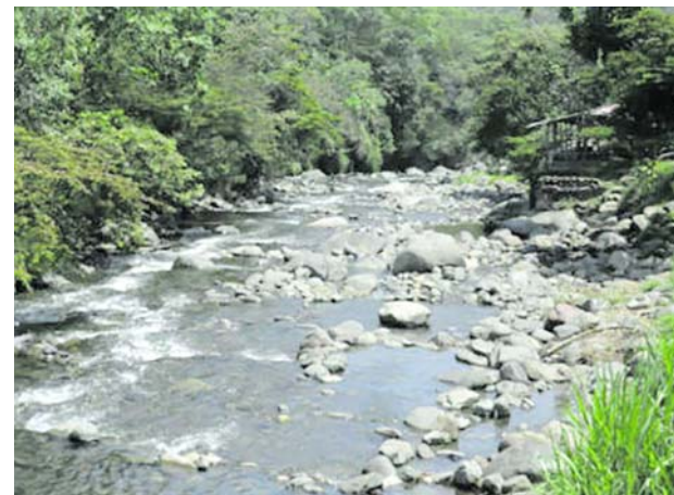
La zona rural de Cali también se capacita en torno a la COP16.

El trabajo con los consejos comunitarios es de gran importancia durante esta temporada de avistamiento de ballenas, con el fin de garantizar un turismo sostenible en esta región biodiversa.