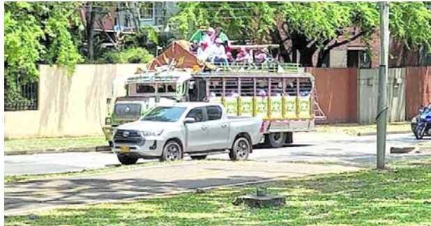
La Minga indígena llegó a Cali para entregar propuestas sobre biodiversidad en la COP16.

principales vías de la ciudad hasta llegar al Centro de Eventos Valle del Pacífico, donde se desarrolla la COP16. Durante el trayecto, los indígenas reiteraron su compromiso con la defensa del medio ambiente y de sus territorios.