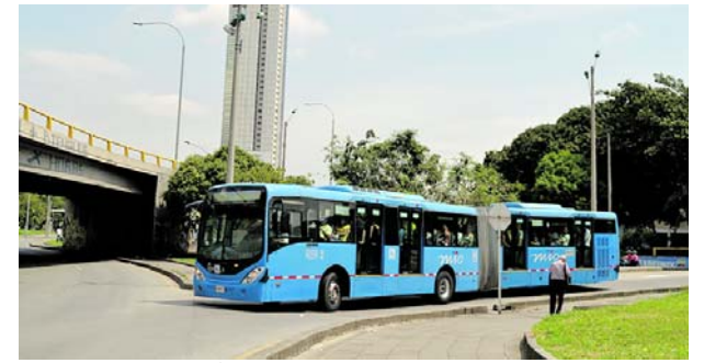
Rutas del MIO conectarán a caleños y turistas con la COP16.

Las actividades incluyeron discusiones sobre la importancia de los territorios indígenas en la conservación de la biodiversidad y la necesidad de establecer medidas especiales para proteger estos espacios en la agenda internacional.