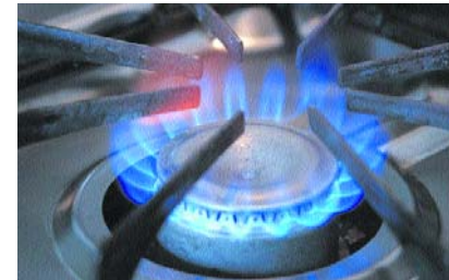
La crisis del gas podría llegar antes de lo esperado según informó Naturgas.

al 12% del total de la demanda nacional y en el 2026 empieza a incrementarse al 30%”.