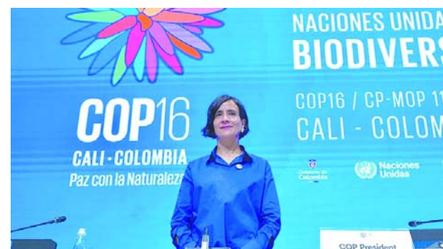
Susana Muhamad se posesionó como presidenta de la COP16 por su liderazgo en el sector ambiental.

El mandatario de Cali participó en el Open House de la COP16 de la Universidad Javeriana Cali, en el que docentes y estudiantes recorrieron los ecosistemas del campus asociados a las 23 metas de la biodiversidad.