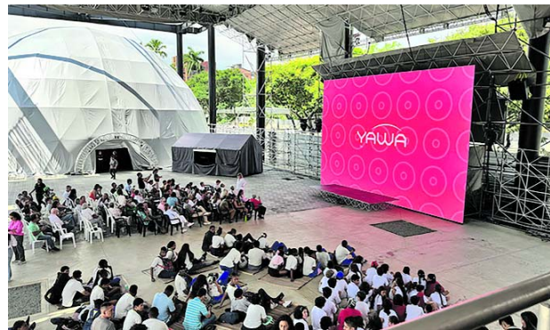
Explora Circuito Terra en Yawa: una experiencia inmersiva sobre biodiversidad en la COP16.

El Circuito Terra incluirá experiencias inmersivas, cine, música, charlas y otras actividades enfocadas en temas cruciales como la conservación de los océanos, el turismo regenerativo, las aves, el Amazonas y los guardianes de la naturaleza. Además, habrá una