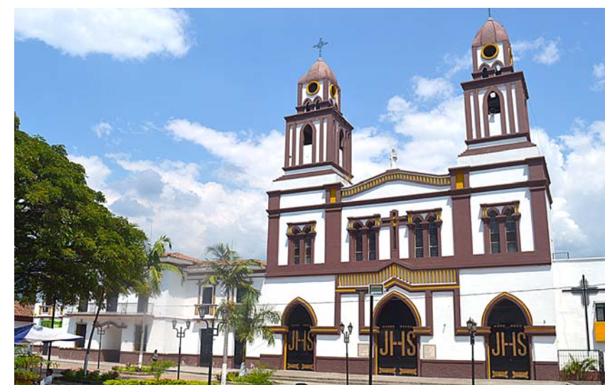
La Parroquia Antonio de Padua de Florida, inaugurada en 1956, su construcción duró diez años, con ayuda de la comunidad.