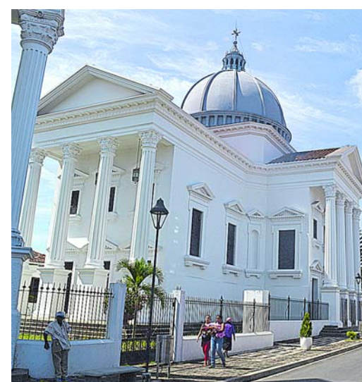
Esta es la Catedral de Cartago, de estilo neoclásico, construida a mediados del siglo XX.