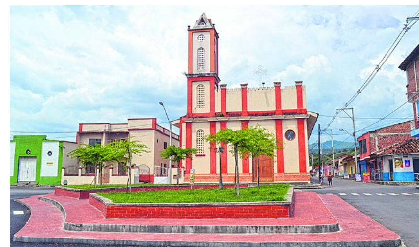
La Iglesia San Pedro Apóstol, construida a comienzos del siglo XIX, rinde homenaje al patrono del municipio de San Pedro.