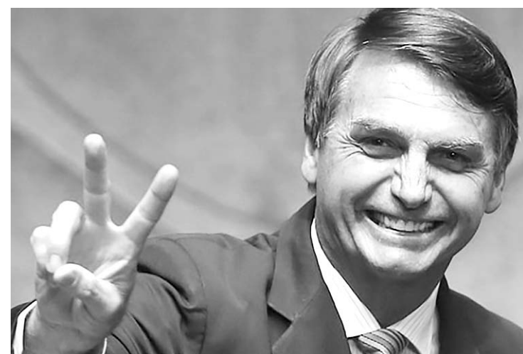
Jair Bolsonaro triunfó en casi todo Brasil, con el 56% de los votos contra el 44% de Fernando Haddad,

En reiteradas oportunidades, Jair Bolsonaro ha asegurado tener mano dura contra la delincuencia y permitir la venta de armas para civiles, así como ha anunciado una línea neoliberal en la economía, con privatizaciones y una fuerte disminución