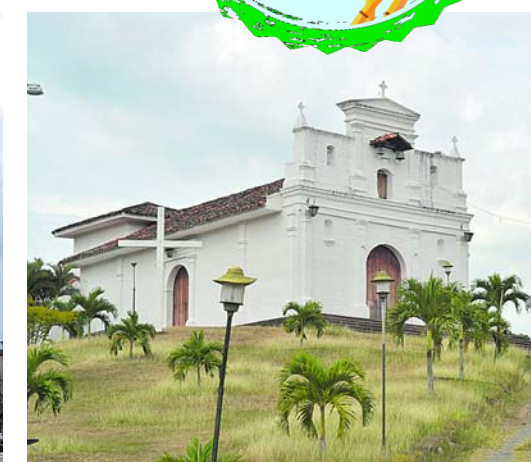
Ermita Nuestra Señora Las Lajas fue oratorio familiar del fundador de La Unión en 1682.