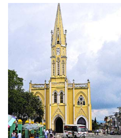
La Iglesia San Luis Gonzaga de Sevilla fue elevada a Basílica Menor en 2015.