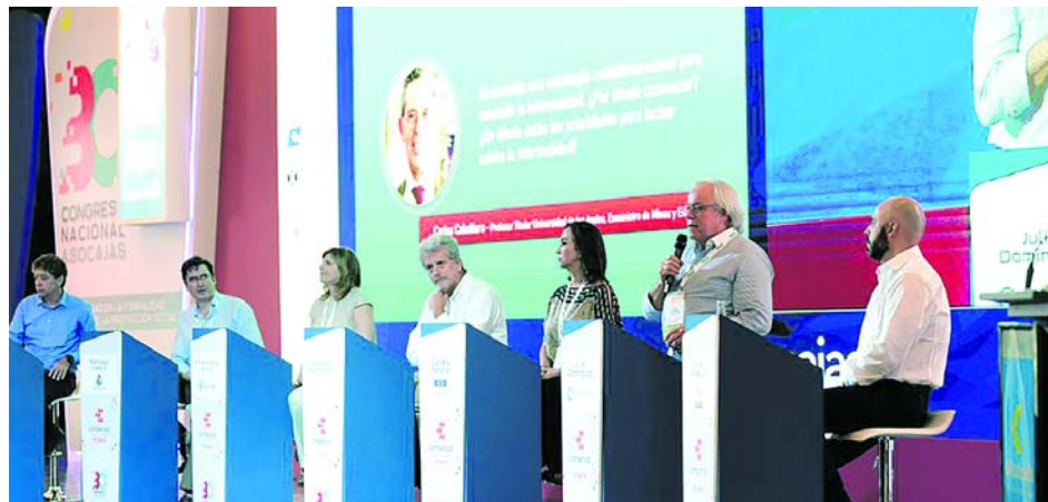
En el panel participaron las cabezas de los gremios más importantes del país.

Los presidentes de los gremios más importantes del país destacaron que la lucha contra la informalidad debe ser un trabajo multidimensional y mancomunado entre gobierno, empresarios y trabajadores que permita desarrollar programas, mecanismos y herramientas que se ajusten a las necesidades reales del mercado laboral colombiano. La informalidad debe tratarse en todas las etapas