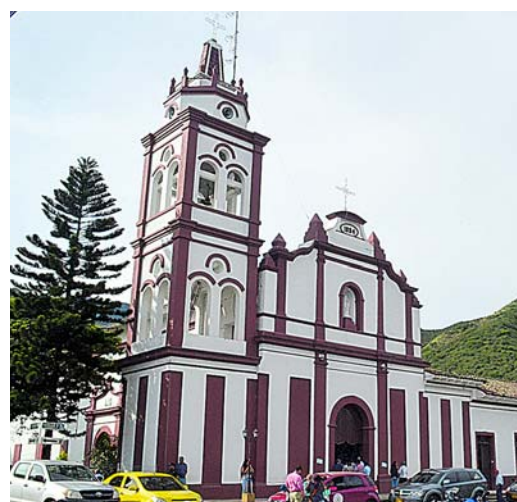
Iglesia de Vijes, posee una pintura de 1898 de Nuestra Señora del Rosario de Chiquinquirá.

Están además importantes centros de peregrinación hasta donde llegan personas no sólo de diferentes partes de Colombia sino del mundo, como la Basílica del Señor de los Milagros de Buga, o el Santuario del Divino Ecce Homo en Bolívar.