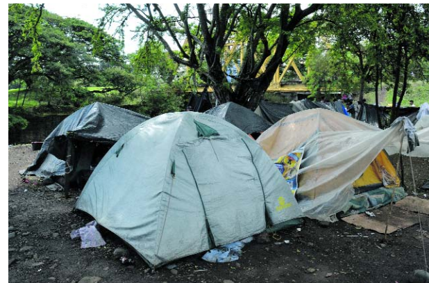
Este es el improvisado campamento en el que viven

Cuando le pregunté por las carencias más inmediatas que tienen él y sus compatriotas, la respuesta me sorprendió, pues más que elementos materiales, tienen necesidades espirituales: "Tenemos gente con enfermedades, que jamás han ido al médico o tomado medicamentos, carpas, plástico, vasos. No es necesidad de frío o hambre, aquí hace falta el amor y la mano de Dios. Somos personas que vivimos aquí adentro como