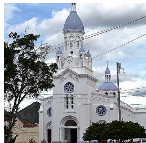
Parroquia de San José en La Unión, en la que se destacan vitrales de colores llamativos.