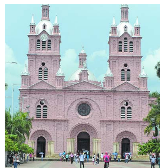
Basílica del Señor de los Milagros de Buga, centro de peregrinación, inaugurado en 1907.