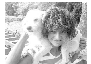
"Cien Pesitos"...¿Qué cuenta de ella Ventana?...Lea.

nacional aquella vez en que fue atropellada por una moto y cuatro perros que la acompañaban la siguieron hasta el Hospital El Divino Niño al que la llevó una ambulancia, uno de los canes, "Pulgoso" su amigo de siempre, se subió a la camilla y luego a la ambulancia. Los paramédicos no salían del asombro y tuvieron que dejar que "Pulgoso" la acompañara y, además, marchar despacio porque los demás perros siguieron el