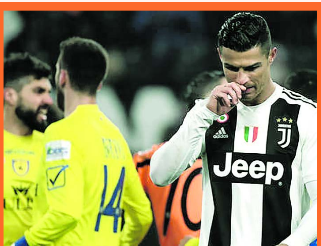
CR7 y Duván Zapata lideran la tabla de goleadores.

Juventus nuevamente disfruta de la distancia de 9 puntos sobre Napoli, su escolta en la tabla de posiciones en Italia, tras ganar un duelo disputado contra el colista, Chievo Verona, por marcador de 3-0, en un compromiso válido por la vigésima fecha de la Serie A.