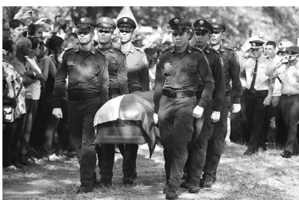
Especial Diario Occidente

Ceballos aseguró que la guerrilla del Eln tuvo una "gran oportunidad para demostrar su voluntad de