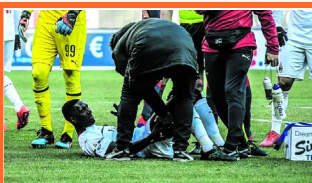
Se esperan los exámenes para definir la gravedad de la lesión.

Milan obtuvo un valioso triunfo visitando a Genoa por marcador de 2-0, con goles del italiano Fabio Borini y del español, Jesús Fernández Sáez, más conocido como Suso. En un duelo correspondiente a la vigésima jornada de la Serie A italiana.