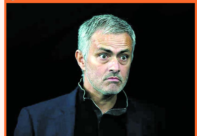
José Mourinho recordó un suceso del 2005.

En relación a la pasada edición de la Champions League del año 2005, el flamante entrenador portugués, José Mourinho, confesó una anécdota en la que según él; ¡casi se muere asfixiado! Esto tiene que ver con que en ese momento, 'The Special One' estaba suspendido y para poder ingresar al vestuario, se escondió en el canasto de la ropa sucia, con la mala fortuna de que cerraron la tapa y el ex Real Madrid empezó a tener problemas para respirar.